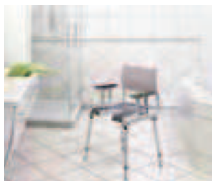
Chaise pour la douche Réf 15432633