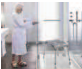
Tabouret pour la douche Réf 1532661