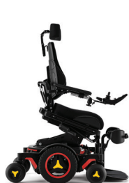
Bascule d'assise avant/proclive