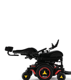
Inclinaison de dossier