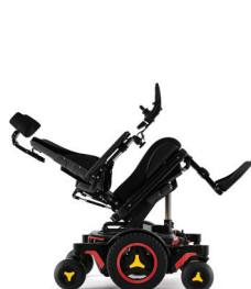
Bascule d'assise arrière