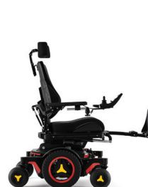
Relève-jambes réglables en angle